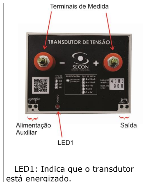
Diagrama de Conexões: